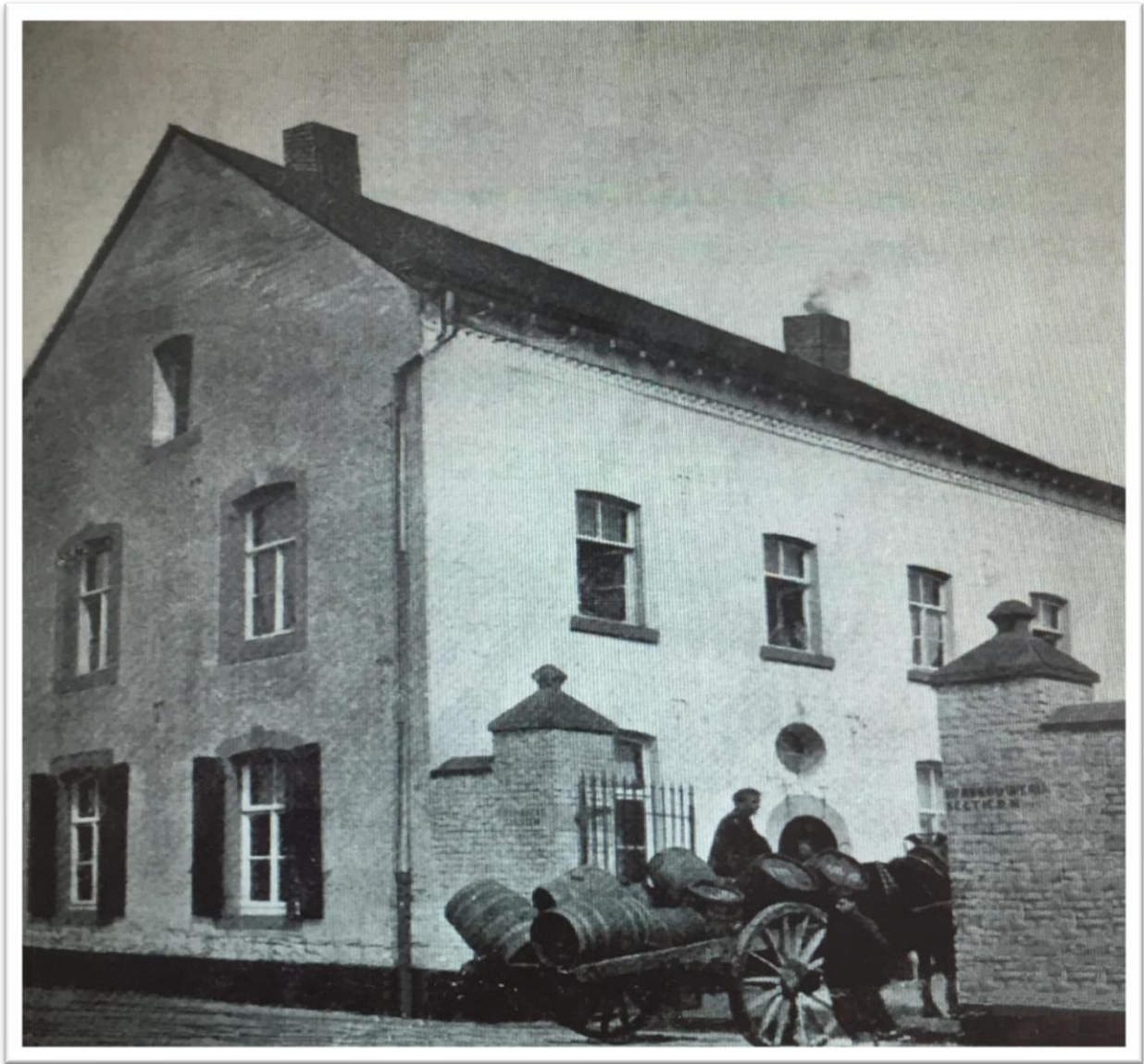
Brouwerij De Hoop (voor 1914) in de Kerkstraat