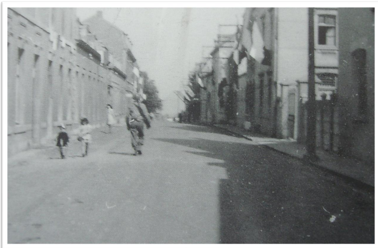
Bevrijding Kerkstraat 1944, rechts Brouwerij De Haan