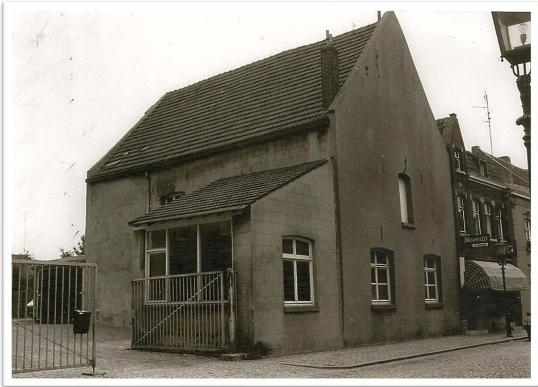
Brouwerijgebouwen voor de afbraak in de jaren 70