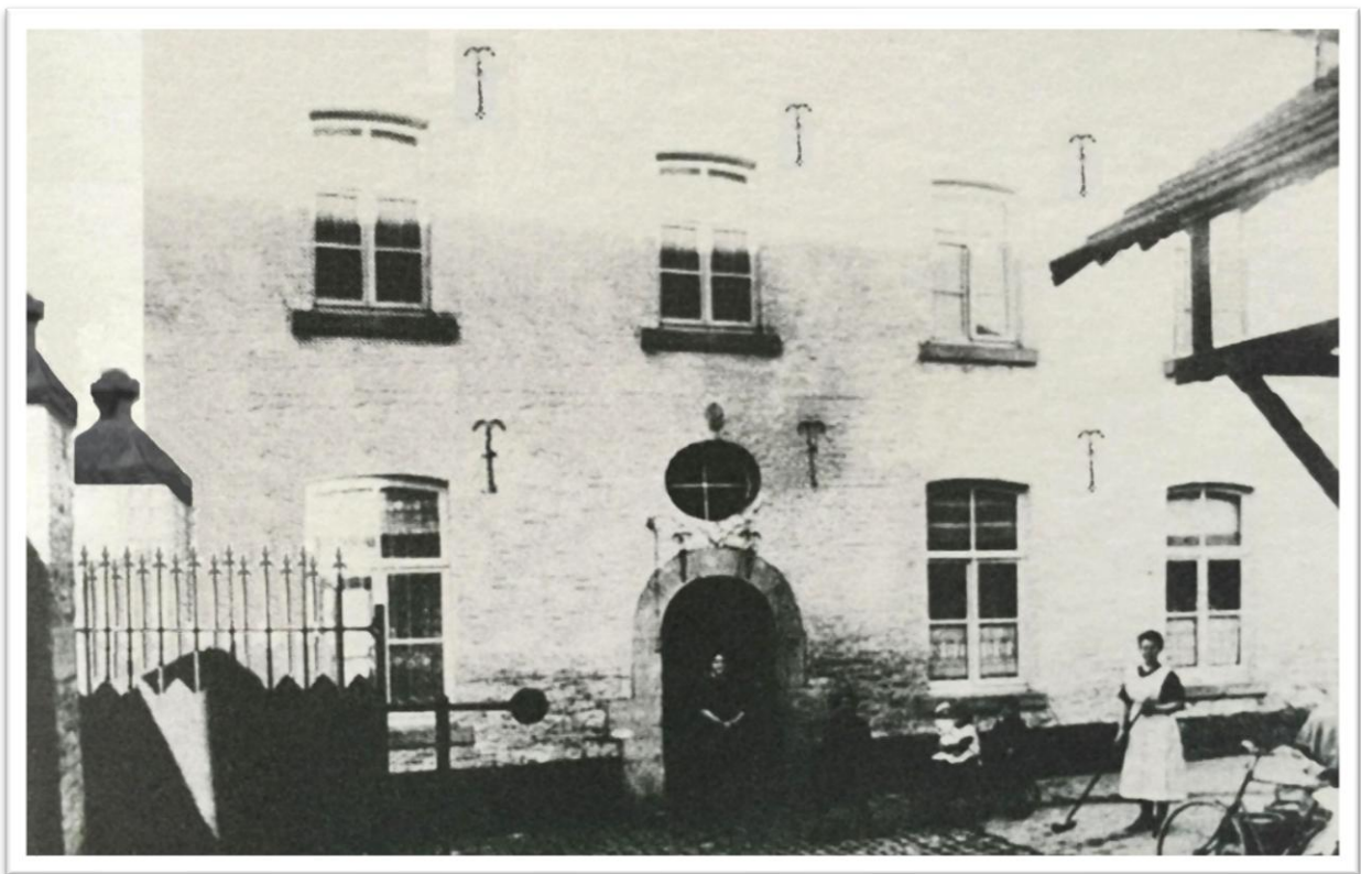
Kerkstraat 21 in 1922