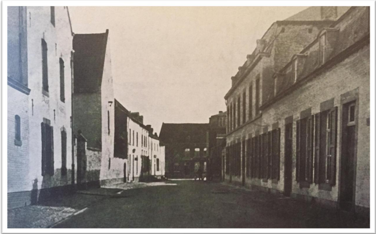
Brouwerijgebouwen in de Kerkstraat begin 20 e eeuw