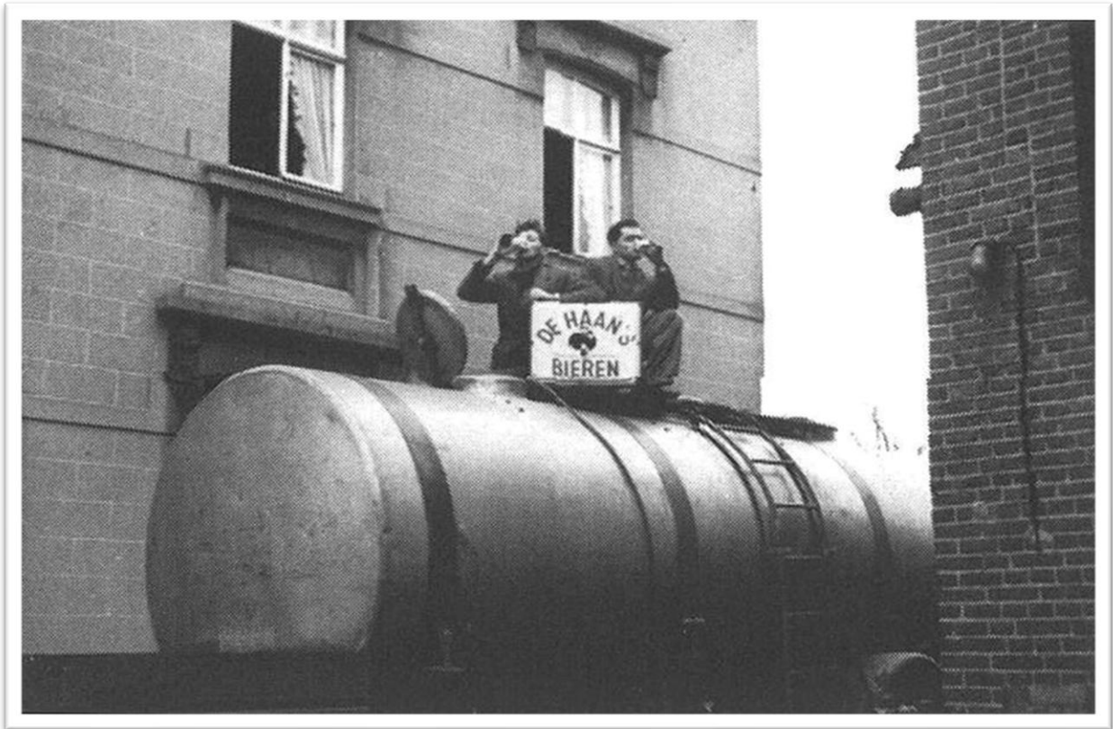
1959 De laatste tank met De Haan bier gaat naar Zoeterwoude (Heineken)