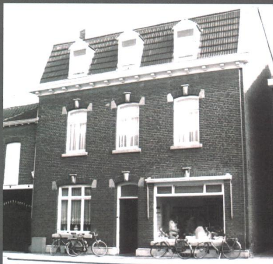
Charcuterie Jos. Henquet