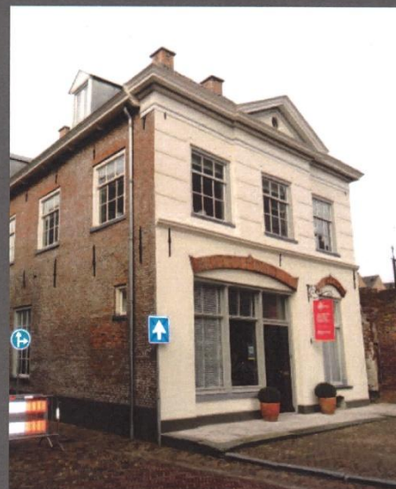
Voormalige slagerij Degeman in Grave

Tegen kost en inwoning kon hij daar werken en kreeg hij daar het slagersvak geleerd. Net als andere knechten sliep hij in een ruimte boven een stal.