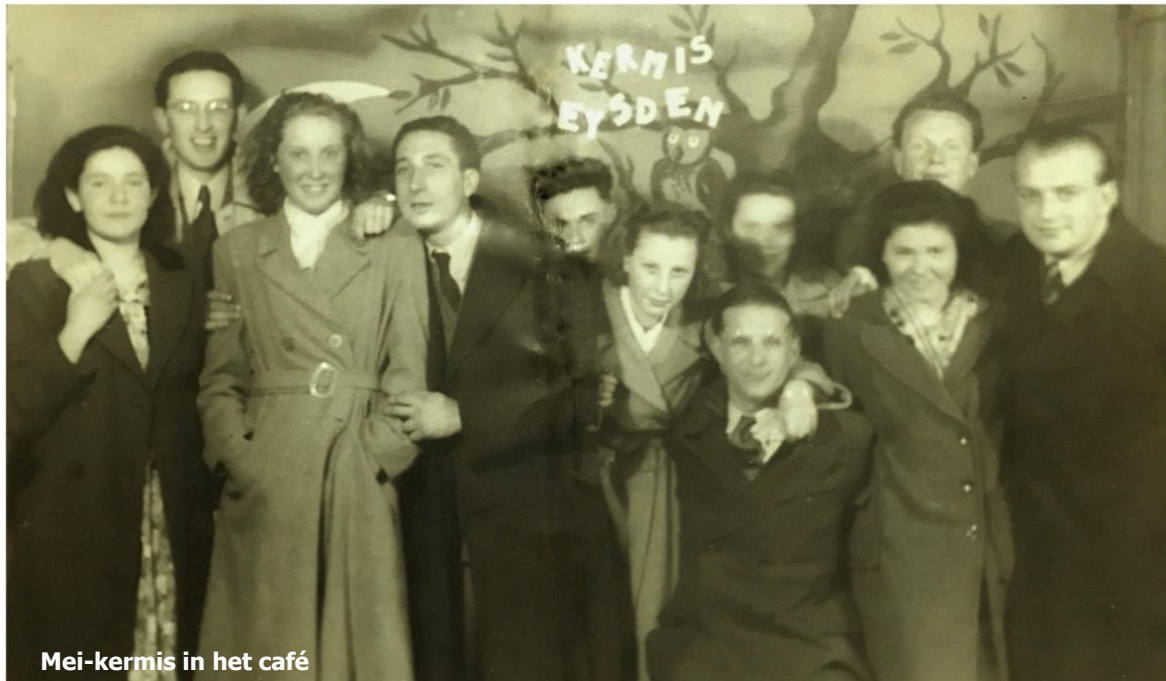
Mei-kermis in het café

Het café speelde een belangrijke rol bij feesten en tradities. Tijdens de Meikermis op het Stationsplein was het er bijzonder druk. Orkesten traden niet op, maar de harmonie kwam tijdens haar rondgang binnen om te spelen. Ook Bronkmaandag werd gevierd, zij het in bescheidener vorm dan tegenwoordig. Carnaval stelde in vergelijking met andere Cafés weinig voor.