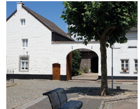
Typisch Zuid-Limburgse wit geverfde boerderij

Op de zogenaamde Tranchotkaart uit 1803 staan deze paden reeds aangegeven en ze worden door de Eijdsense bevolking ook wel geitenpaadjes genoemd. Op iedere hoek van het plein begint namelijk een straat en komend uit een van die straten staken de mensen liever het plein kruislings over. Als er in de winter een tijdje sneeuw heeft gelegen is dat mooi zichtbaar.