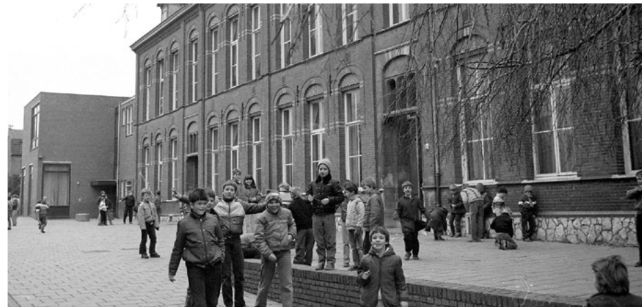
Voormalige jongensschool St. Martinus

Enkele meters verderop in de Breusterstraat ziet u al van verre een grote beuk, een treurbeuk . Deze beuk staat op de speelplaats van de voormalige jongensschool St. Martinus . Een boom die bij veel Eijsdenaren herinneringen zal oproepen.