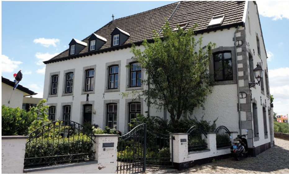
Het pand nummer 3-4

De meeste oude panden langs het Bat zijn gerestaureerd. Het pand nummer 3-4 heeft segmentboogvensters van hardsteen en de gevel laat een onregelmatig patroon van hoekblokken zien. Het huis is in de tweede helft van de 18e eeuw gebouwd. Aan dit pand bevond zich vroeger een meetlat om de stand van het Maaswater te meten. Het pand op nummer 7 is ook uit die tijd en is tot omstreeks 1930 in gebruik geweest als veerhuis. Het diende als café met de hele mooie naam: 'Café du passage d'eau'. Tot die tijd was er een voetveer naar het dorp Ternaaien in België, aan de overkant van de Maas. De bewoners van Ternaaien gingen vaak naar Luik en dan werd gebruik gemaakt van de mogelijkheid om in Eijsden de trein naar Luik te nemen. Dat scheelde aanzienlijk in reistijd. Sinds 2004 is met succes een nieuw voet- en fietsveer