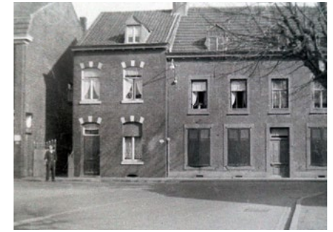
Vroegere huizen aan de Wilhelminastraat

Komend vanaf de Maas merkt u dat de straat enigszins omhoog loopt en lijken de lindenbomen vooral groot en statig aan weerszijden van de straat. Het exacte plantjaar is onbekend maar ze zijn vermoedelijk tussen 1870 en 1880 geplant. Tot op heden worden ze gekoesterd. Ze zijn erg beeldbepalend. In de beginjaren liet men de bomen doorgroeien tot ver voorbij de nokken van de daken. Ze namen veel licht weg en op een gegeven moment zijn ze geknot. En dat is men blijven doen tot op heden. Zodoende hebben de linden die typische kronen gekregen.