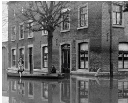
Café La Meuse

Het zijn vaak de details die de moeite waard zijn om te bekijken en zo'n detail bevindt zich op het pand met huisnummer 44, café La Meuse , een pand met segmentboogvensters en een segmentboog boven de ingang.