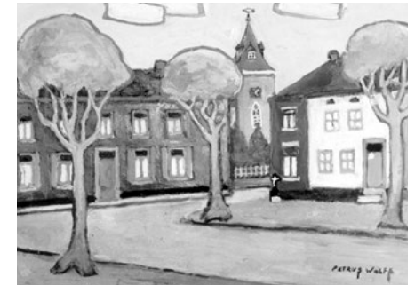
'Op G'n End' van Petrus Wolfs