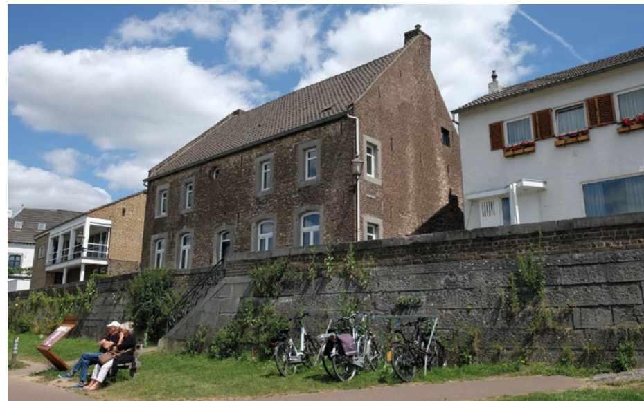
'Het Bat' aan de Maas