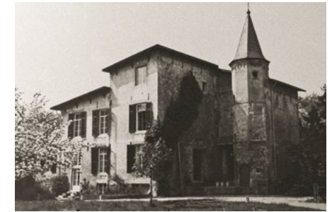
Kunstenarskolonie in kasteel Oost