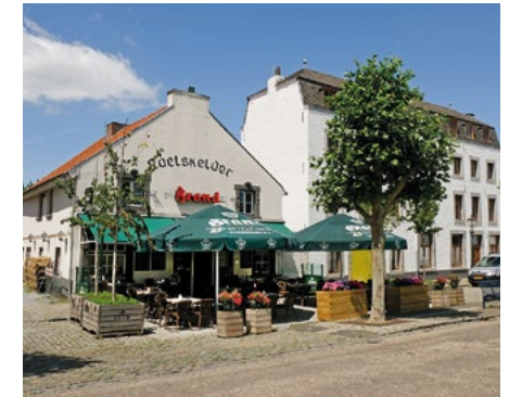
Café 'De Raetskelder'

Het meest opvallende aan de Vroenhof is dat tijdens de renovatie twee van oudsher gebruikte paden, die elkaar kruisen in het midden van het plein, zichtbaar zijn gemaakt in de huidige bestrating. Dit is zo uitgevoerd omdat die twee paden zo'n tweehonderd jaar geleden al waren aangelegd en destijds, naar men vermoedt, werden geflankeerd door bomen.