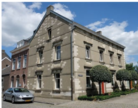
Het pand Kerkstraat 21