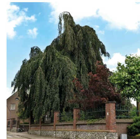
Treurbeuk op de speelplaats

Bij de treurbeuk ziet u een kunstwerk van kunstenaar Désiree Tonnaer. Het is een bronzen beeld dat in 1997 door de Stichting Woningbeheer is geplaatst nadat het seniorencomplex was gerealiseerd. Het beeld heeft als titel 'de Schutsboom' en heeft een organische vorm. Door de nieuwe invulling heeft deze plek in de Breusterstraat een moderne 'look' gekregen, met het seniorencomplex op de achtergrond te midden van de statige herenhuizen die in deze straat te zien zijn.