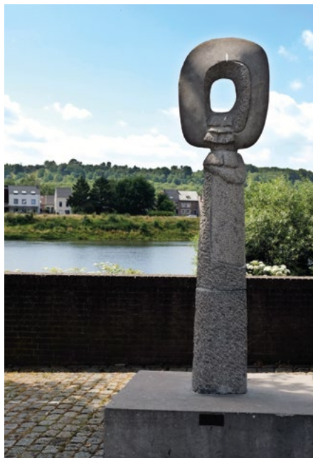
Beeldhouwwerk 'Bloesem van het niets'

Op verschillende plekken in Eijsden zijn beelden van beeldhouwer Cor van Noorden te bewonderen. Een zwaar massief