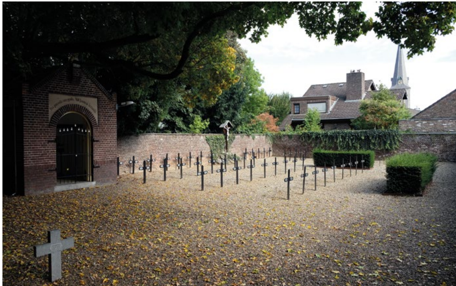
Het kerkhof van de zusters

Achter de Mariagrot bevindt zich het oudste gedeelte van het Kloosterpark, de voormalige bosschage met daarachter het kerkhof van de zusters dat op afspraak toegankelijk is. In het park staan mooie inheemse en monumentale bomen zoals beuken, esdoorns, linden, een paardenkastanje en een paar acacia's. Kenmerkend bij oudere bossen uit de late landschapstijd (aanlegperiode park), zijn de zogenaamde stinze planten. Onder de bomen werden bollen en knollen aangeplant ter verfraaiing, met geur en kleur, om de rust en sereniteit te bevorderen. In het voorjaar kleurt de grond dan ook fraai wit door de bloemen. In de zomerdagen is de groene specht nogal actief en is dan vaak te horen als hij bezig is zijn voedsel uit de spleten achter de schors te halen. Er voeren ver-