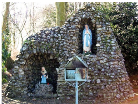
Lourdesgrot in het Ursulinenpark

Hier is goed te zien dat het gebouw oorspronkelijk meerdere vleugels heeft gehad. In 1997 is ten behoeve van het toenmalige gemeentehuis een nieuwe uitbouw gerealiseerd. De uitbouw is een ontwerp van architect J. Mingels. Het is een modern uitgevoerde uitbouw met een spits toelopend zinken dak. Rondom het Ursulinenconvent bevindt zich een park.