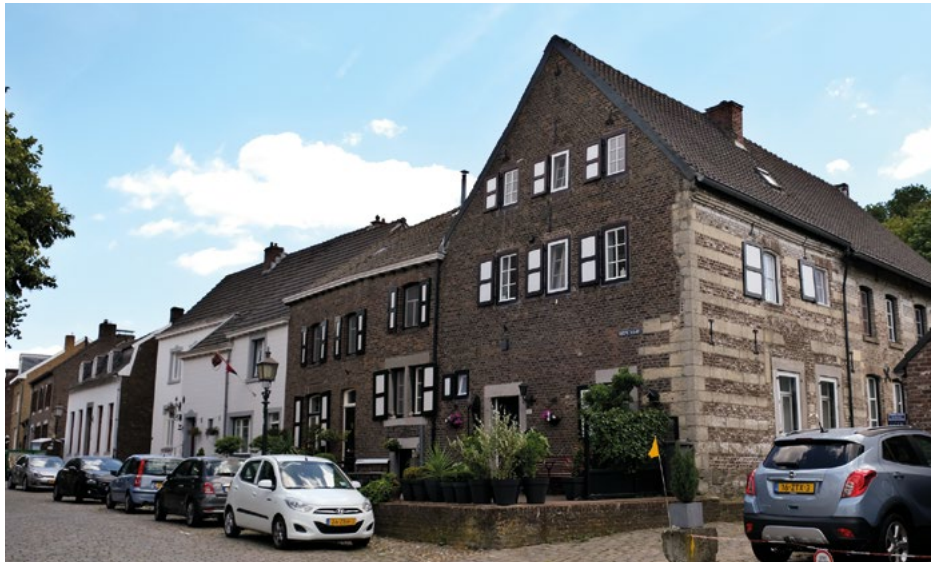
Monumentale panden in de Diepstraat

In de Diepstraat bevindt zich een aantal prachtige monumentale panden die de moeite van het nader bekijken waard zijn. De eerste twee ziet u al meteen voordat u de Diepstraat inloopt. Het zijn de panden met huisnummer 75 en 77 . Hier ziet u in de gevels resten van mergelstenen speklagen en hoekblokken. De meeste panden in de Diepstraat hebben achter de stenen gevels een vakwerkskelet. Tot in de 16e eeuw werden vakwerkhuisen gebouwd. In het begin van de 17e eeuw kwam een versterkingsproces op gang.