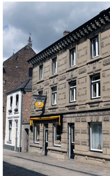
Panden met huisnummer 3 en 5

Een recent gerestaureerd pand is Kerkstraat 15 . Op 12 september 1791 werd door Dirk Daniel Vonk, zoon van predikant Nicolaas Vonk, de eerste steen gelegd. Het pand was bedoeld als ambtswoning voor de predikant van de Nederlands hervormde gemeente van Eijdsden. De Staten-Generaal keurden in eerste instantie de bouwplannen af omdat het te duur zou worden. Er moest bezuinigd worden en die bezuiniging werd doorgevoerd door 'blauwe stenen venster-gespannen' van mindere kwaliteit te kiezen. Overigens voldoen die omlijstingen tot op de dag van vandaag.