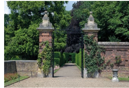
Smeedijzeren hek uit ca. 1900

Het centraal gelegen in Jugendstil uitgevoerde dubbele smeedijzeren hek werd omstreeks 1900 geplaatst.