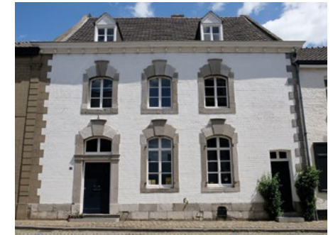
Het witgeschilderde pand nr. 27

De kerk is in neogotische stijl gebouwd in 1906 naar een ontwerp van architect Odinet uit Wijk bij Duurstede. Het is een van de weinige hervormde kerkjes in Limburg. De kerk is recentelijk in fases gerestaureerd. Zo is bijvoorbeeld de torenspits in zijn geheel van de toren gehaald en na weer voorzien te zijn van een nieuwe leistenen dakbedekking terug op de toren geplaatst. De binnenmuren van de kerk zijn opnieuw beschilderd door kunstenaar Sjef Hutschemaekers. Teruglopend naar de Kerkstraat is mooi te zien hoe de Diepstraat geleidelijk aan omhoog loopt vanuit het Bat.