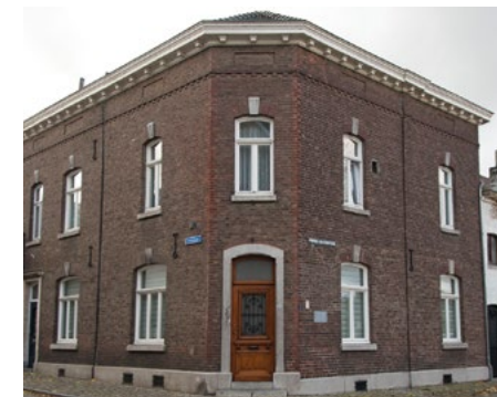
Woonhuis Petrus Wolfs

De Kerkstraat is nu een deftige, met stadse allures, ogende straat. De opvallende kroonlijsten aan diverse panden evenals de bewaard gebleven gevelaanzichten zoals de panden met huisnummer 3 en 5 , drie verdiepingen hoog, geven dat extra cachet. Links ervan een piepklein huisje dat een charmant contrast vormt.