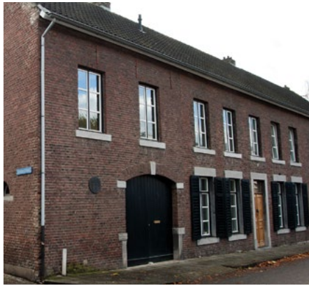
Geboortehuis van Eugène Dubois