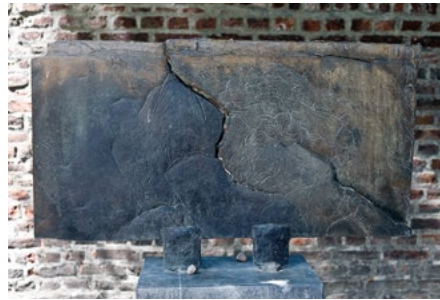
Kunstwerk 'De Breuk'

Ongeveer vijf meter links van het Verzetsmonument bevindt zich een kunstwerk uit 2001, 'De Breuk' . Het kunstwerk is tevens een gedenkteken ter nagedachtenis aan de Joodse slachtoffers uit Eijsden en Gronsveld. Het is een kunstwerk van de kunstenaar Ria Erckens. U ziet een rechthoekig vrij plat bronzen plastiek op een bijna anderhalve meter hoge sokkel van hardsteen. De voorkant stelt het verscheurde Beloofde Land van de Joden voor en aan de achterzijde staan de namen van de in de oorlog weggevoerde Joden uit Eijsden en Gronsveld. Het kunstwerk werd op 12 september 2001 onthuld, de dag dat Eijsden de bevrijding herdenkt.