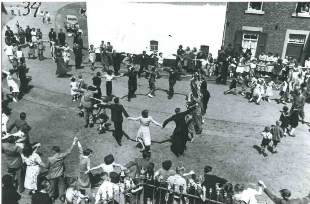
Afb. 5. Op maandag wordt de cramignon in Breust en aan het Station gedanst. Opname Breust (Sint Martinusstraat), 1952 Collectie SEV nummer 197).

plet [nu Stationsplein 2; Chinees-Indisch restaurant Lan's Garden] waar men even pauzeerde voor een glas bier. Als plotseling de trom geroerd wordt, springt de Jonkheid recht en bij de inzet der muziek is het alsof iemand ergens een electrisch contact heeft ingestoken en dan barst het geweld los. De sliert danst en kronkelt en de jongens en meisjes rukken aan de armen alsof zij bij iedere zwaai hun buurmeisje of jongen in de lucht willen tillen. Zo danst de sliert, en het gaat met geweld door de huizen heen, vóór in en achter uit. De Cramignon trekt van vijf uur tot 's nachts twaalf. Het zijn niet alleen de jonge mensen, maar vooral op Dinsdag in Eysdenkom, ook de ouderen die worden aangegrepen door 't Cramignon-vuur. Met soevereine bruine gezichten staan de Ambonnezen (Sic!)[zij waren gehuisvest in het inmiddels afgebroken Capucijnenklooster te Breust] deze inboorlingendans te bekijken. Oververmoeid, schoenen kapot en voor acht dagen spierpijn, zo rolt de Eysdense Jonkheid die avond te bed. En een al wat kalmer Eysdenaar, vader van een stoet kinderen, bekent ons, dat in die Cramignon voor hem alles samengepakt zit van zijn dorpsjeugd, zijn eerste