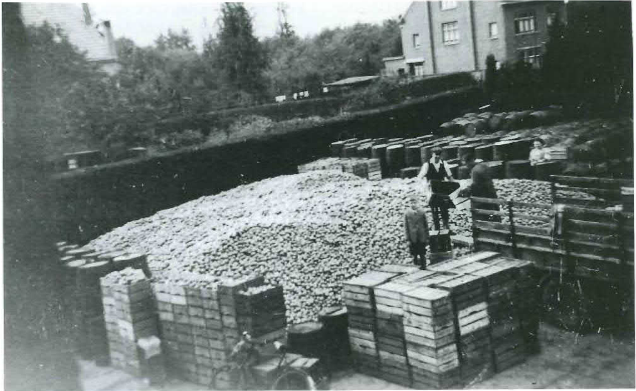
Afb. 5. Opslag van appels ten behoeve van de stroopproductie bij de voormalige Stroopfabriek Henquet aan de Prins Hendrikstraat, 1939 (collectie SEV nr. 2743).