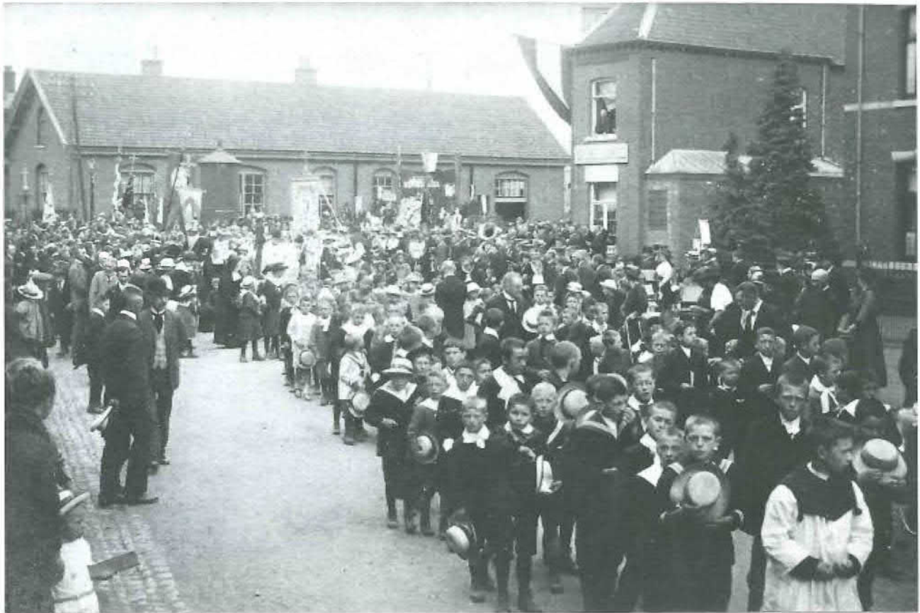
Afb. 2. Tijdens de rondgang wordt even stilgestaan bij rustaltaren waar de benedictie wordt gegeven. Opname aan het Station (op de achtergrond een voormalig pakhuis) richting Laag-Caestert via de Caestertstraat. Op de voorgrond communicantjes, wat verder in de stoet diverse verenigingen met hun vlaggen, op de achtergrond een rustaltaar (collectie SEV nummer 114, ca. 1920.)

ken: rijste-, kronsele- [kruisbessen], appelekouwe- [abrikozen] en kersenvlaaien, linzetaarten, waarvoor Ezau zijn eerste-geboorte-recht verkwanselde [ten gunste van zijn tweelingbroer Jakob (Genesis 25:29-34: Esau kwam hongerig thuis; Jakob gaf hem te eten in ruil voor het eerstgeboorterecht)], grummele-vlaai met crème er onder, appeltaarten geruit met deeg-streepjes, hele licht gekleurde appelvlaaien en pruimenspijvlaai zwart als schoenwicks [schoensmeer]. Dertig vlaaien voor één gezin is helemaal geen overdreven voorraad. De kantonniërs van de gemeente hebben de wegen en greppels schoongeveegd, tenminste waar de Broonk langs komt, de andere straten komen niet zo nauw en de groene hagen zijn kortgeschoren. Zaterdag is men aan alle kanten bezig met het optimmeren der erebogen, de heiligenhuisjes worden gereed gezet en de kruisstokken geplant, waaraan morgen de vaantjes komen te hangen. In de namiddag ziet ge de deftige meisjes te biechten gaan, en dan is de gewijde avond gevuld met de muziek van de repeterende fanfare.