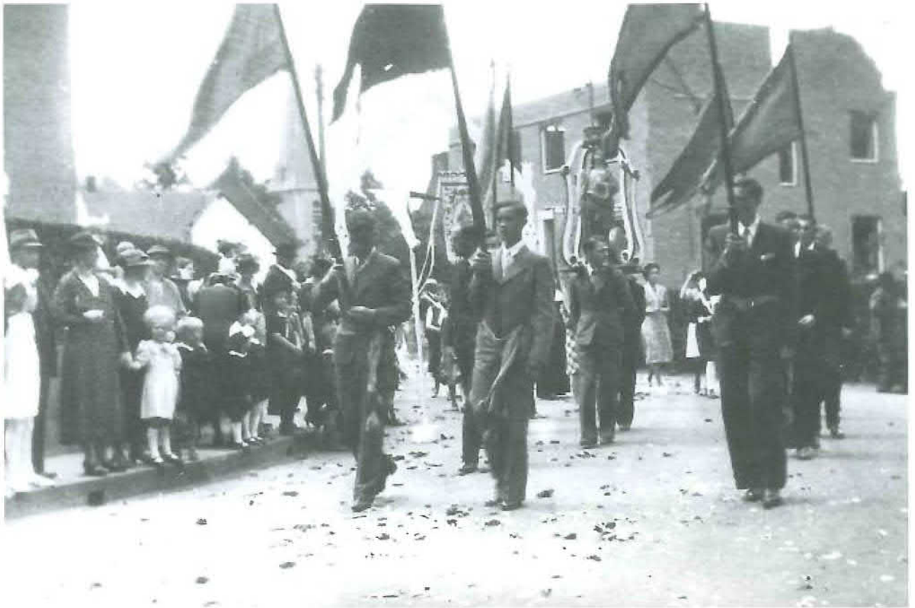
Afb. 3. De jonkheden spelen een belangrijke rol bij het organiseren van de bronk. Op de afbeelding het Jonkheid van Eijsden met het beeld van hun patrones Sint-Christina tijdens de processie in 1939 op de overgang van de Raadhuisstraat naar de Breusterstraat.

in de bronk [lees: processie]. De Jonkheid van Caestert heeft Sinterklaas als beschermer. Zij zijn zeer fier op een prachtig antiek vaandel met die heilige erop, door de kasteelheer in vroeger eeuwen geschonken en vervaardigd door een Italiaans meester uit Turijn. Patroon van de Jonkheid van Breust is St. Martinus en van Eysden-kom St. Christina. Deze hebben ook mooie antieke sabels. Onder Eysden hoort ook nog de Jonkheid van Oost en Maarland, en die komen graag met de schutterij St. Sebastianus van Oost naar de Bronk.