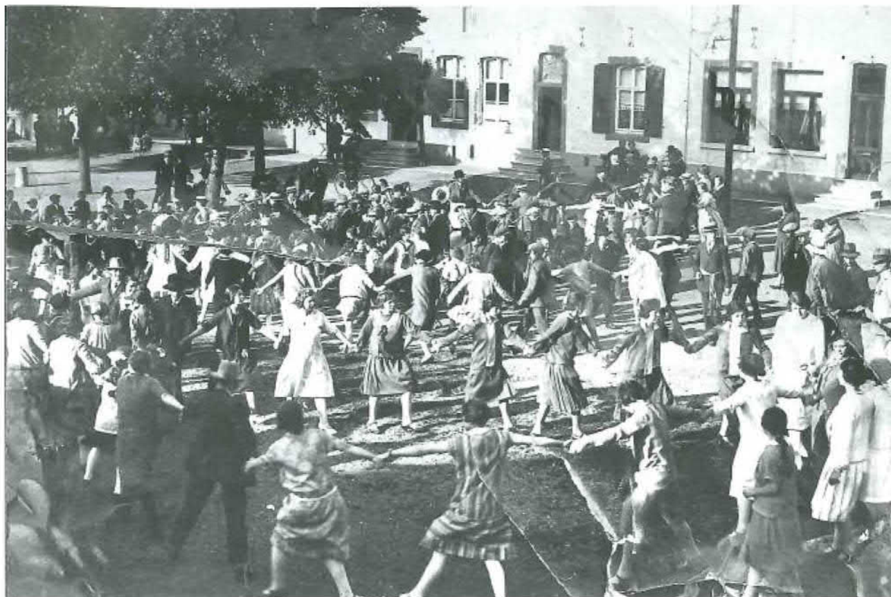
Afb. 4. 'Eysden is vermaard om zijn Cramignon'. Inwoners van Eijsden dansen de cramignon op de Vroenhof, begin 19de eeuw (collectie SEV nummer 226).

Maandag in de bleke prille ochtend, om vier uur wordt de trom al geroerd in alle gehuchten. Nu is het zaak vroeg klaar te komen. Tegen acht uur trekt de Jonkheid van Caestert met de harmonie, de Rode, naar de Mis in de kerk. Het bestuur is weer in vol ornaat, met hoge hoed, oranje sjerp om de zwarte slipjas en de sabel aan de zij. Het wordt geflankeerd door de vaandeldragers. Tijdens de offerande speelt de harmonie in de kerk een processiemars en gaat iedereen ten offer, waarbij hij vooraan in de kerk zijn bijdrage op de schaal deponert. Na de Mis trekt men naar het kerkhof. Hier wordt de lijst der overledenen van de Jonkheid afgelezen, en een salvo wordt over de graven gelost. Hetzelfde doet de Jonkheid van Breust, die om half negen Mis heeft en dan komt om negen uur de Mis van de Schutterij van Oost. De pastoor krijgt na afloop een serenade en voor hem wordt plechtig met de vaandels gezwaaid. Dit moet mooi gebeuren, en in de voorafgaande week hebben de vaandeldragers dit met veel geduld hier of daar in de wei staan oefenen. U kunt wel begrijpen, dat die morgen velen van de Jonkheid niet meer thuis komen, want het blijft niet