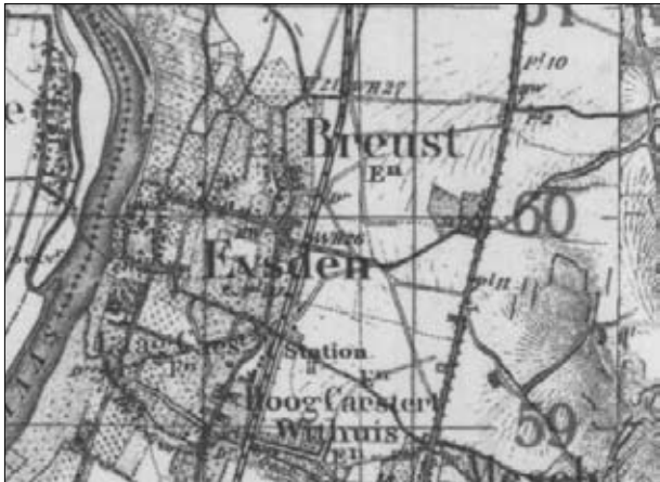
Eijsden, detail uit: Gemeentenkaart van Nederland met de route van de wandeling van Wilhelm van Withuis naar het station van Eijsden. 1918.

over het lukken van de vluchtpoging toe. Er doen zich echter geen nieuwe incidenten voor. Omstreeks 6 uur bereikt het konvooi de grens bij Moelingen. De auto's vertonen geen sporen van beschietingen; ze zijn geheel intact. Ook het treinmaterieel bereikt ongeschonden Visé.