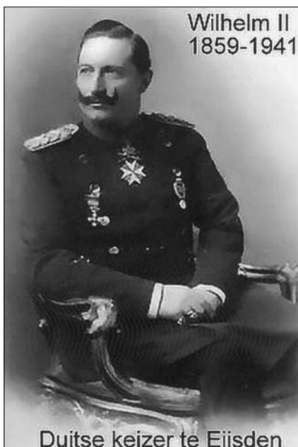
Keizer Wilhelm II ca. 1890. EV 7387.