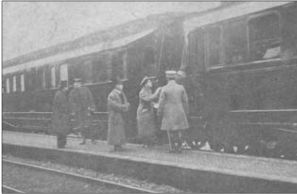
Instappen Nederlandse volksvertegenwoordigers in het rijtuig volgend op dat van de keizer.

De chef van de interneringsdienst is aanwezig bij de aankomst van de keizer op station Maarn. Vandaar zal de ex-keizer per auto naar kasteel Amerongen gaan waar hij tot nader order blijft onder de naam graaf Wilhelm von Hohenzollern. De voorwaarden waaronder hij in Nederland wordt toegelaten vertonen tot op zekere hoogte overeenkomst met de interneringsbepalingen. Volgens het departement van buitenlandse zaken kan er echter geen sprake zijn van internering, omdat de ex-keizer door zijn troonsafstand geen banden meer heeft met het Duitse leger.