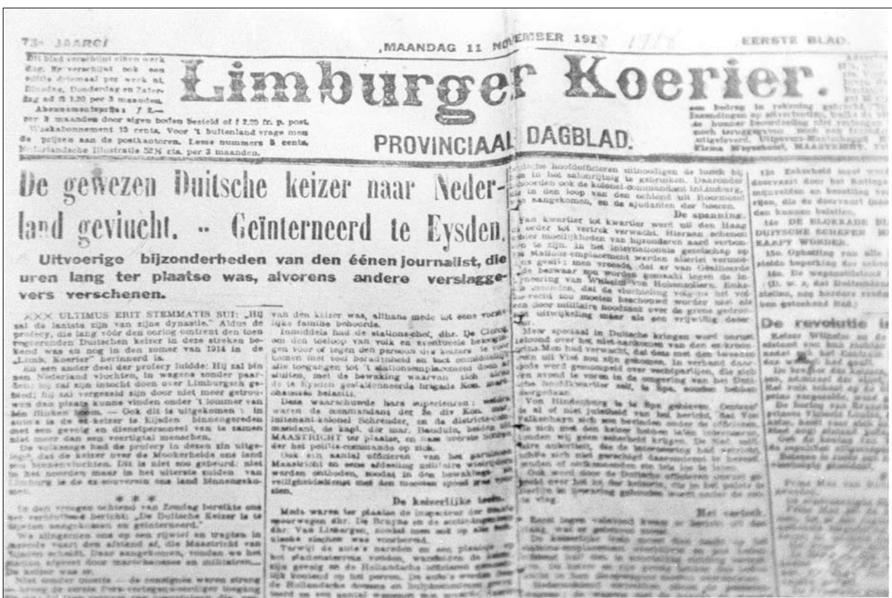
Voorpagina Limburgerkoerier 11 november 1918. EV 3134.

Op 11 november 1918 eindigt om 11 uur 's ochtends de Eerste Wereldoorlog. In het Forêt de Compiègne (F) wordt in een treinwagon de wapenstilstandsovereenkomst getekend. Opmerkelijk is het feit dat Eijsden de plaats is waar de gruweldaden in het aanpalende België letterlijk gezien, gehoord en gevoeld