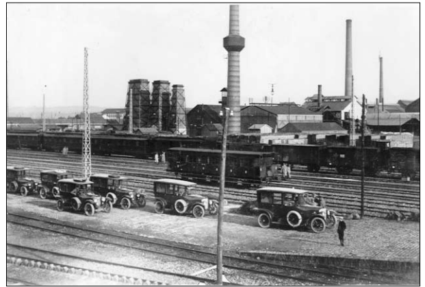
De auto's van het keizerlijk gezelschap op het stationemplacement in Eijsden. EV 3133.

Terwijl het gezelschap zich al op het stationemplacement bevindt, worden de auto's van het konvoi ook daarheen gereden. De auto's worden door de Nederlandse douane gevisiteerd. De wapens, onder meer geweren, revolvers en munitie, worden in beslag genomen en in een bagagewagen opgeslagen.